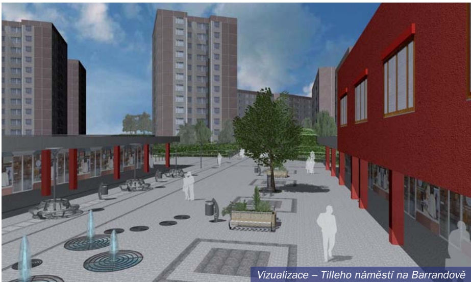
Vizualizace – Tilleho náměstí na Barrandově

Jsme Pražané a zodpovědně vám nabízíme program, který je cestou k úspěchu. Víme, že pravicová politika není pouhou ideologií ani nerealistickou představou, nýbrž nástrojem, který se v Praze historicky osvědčil a který z Prahy učinil ekonomický motor České republiky. Věříme, že pravicová politika není jen pro vyvolené, nýbrž cestou k ekonomické prosperitě všech. Soukromé vlastnictví a svoboda jsou hodnoty, které vedou k rozvoji země, sociální stabilitě a ekonomické prosperitě celé společnosti. Věříme, že sníží-li se administrativní i daňová zátěž kladená na občany, ti se v rámci nabytého prostoru budou realizovat efektivněji a zodpovědněji. Věříme, že pokud si lidé důvěřují, zvyšuje se kvalita jejich soužití a společenských vazeb. Věříme, že důraz na individuální občanskou odpovědnost je nejefektivnější cestou ke spokojenosti a štěstí jednotlivců i jejich rodin.